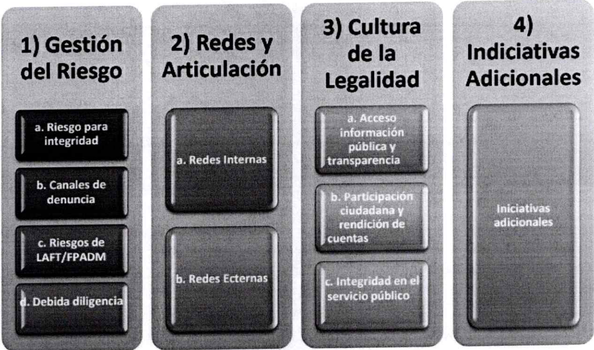
Imagen 2. Estructura del componente programático del PTEP